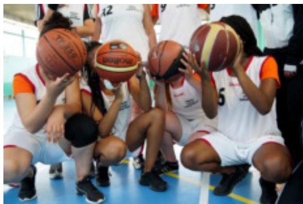
Challenge Michelet édition 2018, épreuve basketball