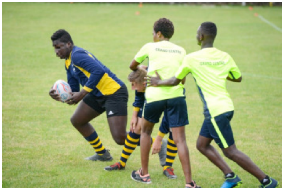
Challenge Michelet édition 2018, épreuve de rugby