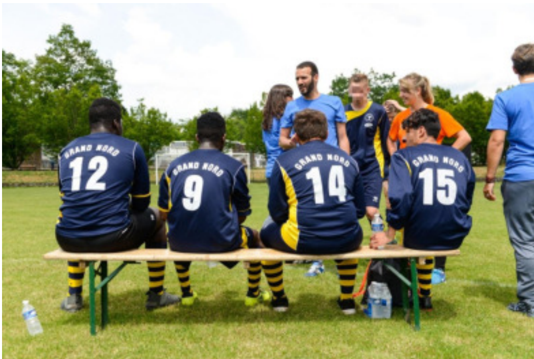
Challenge Michelet édition 2018

p.15 LE DROIT A L'IMAGE DES MINEURS SOUS MAIN DE JUSTICE