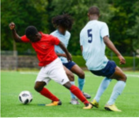
Challenge Michelet édition 2018