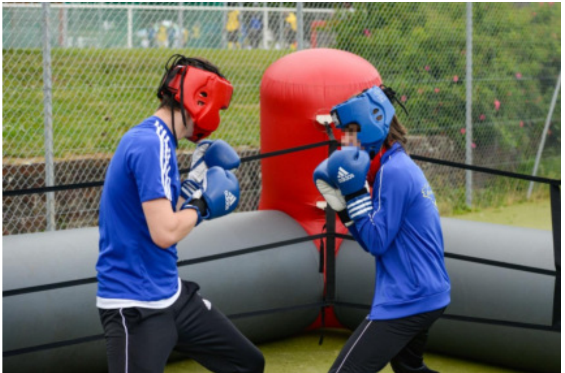
Challenge Michelet édition 2018, atelier boxe