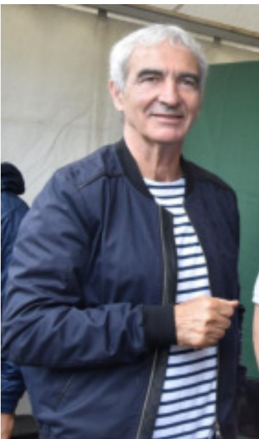
Raymond Domenech au Challenge Michelet édition 2018

Par ailleurs, les jeunes pourront profiter d'un échauffement professionnel par 10 joueurs du LOU Rugby (club de rugby de Lyon, TOP 14) dont Félix Lambey, vainqueur du Tournoi des Six Nations des moins de 20 ans (grand chelem) en 2014 avec l'équipe de France U20.