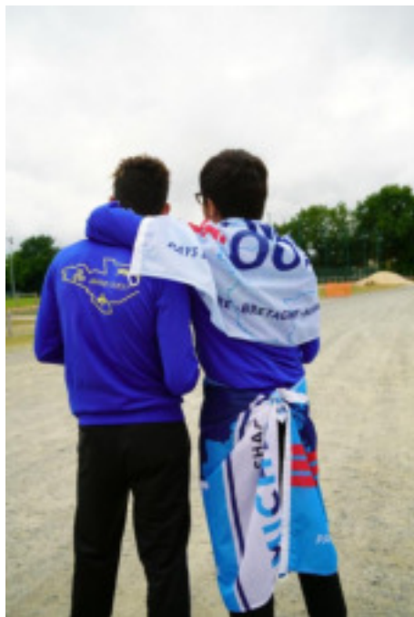
Challenge Michelet édition 2018