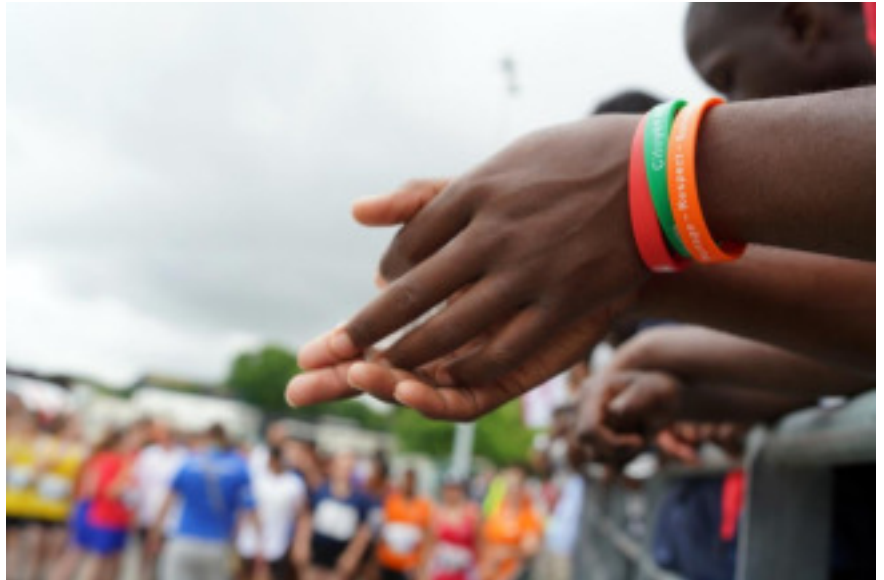
Challenge Michelet édition 2018

« Le Michelet mais plus globalement ce suivi par la PJJ m'a changé la vie ! Heureusement que les éducateurs étaient là ! Avant, j'étais très renfermé et solitaire, je ne voulais pas parler, je ne disais rien. Parfois, je ne venais même pas aux rendez-vous qui m'étaient fixés. Aujourd'hui tout va bien, je travaille, j'ai passé mon permis de conduire, j'ai ma voiture, je pars en vacances, et les tensions avec ma mère se sont apaisées. J'ai aussi pris beaucoup plus confiance en moi et ça m'a ouvert les yeux sur le sens de ma vie, sur le fait que, quand on a envie de quelque chose, on peut réussir. Il suffit de travailler pour y arriver. »