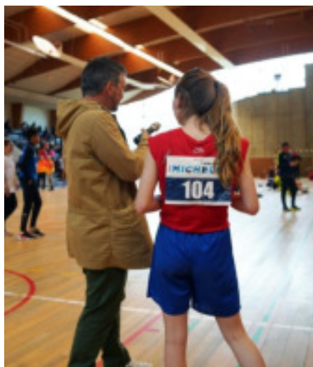
Challenge Michelet édition 2018

C'est un événement sportif et éducatif d'ampleur nationale qui réunit pendant une semaine des centaines de jeunes ayant commis un acte de délinquance autour de disciplines sportives et d'activités éducatives.